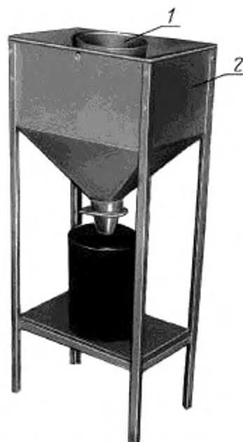
1 — емкость измерителя; 2 — лещик