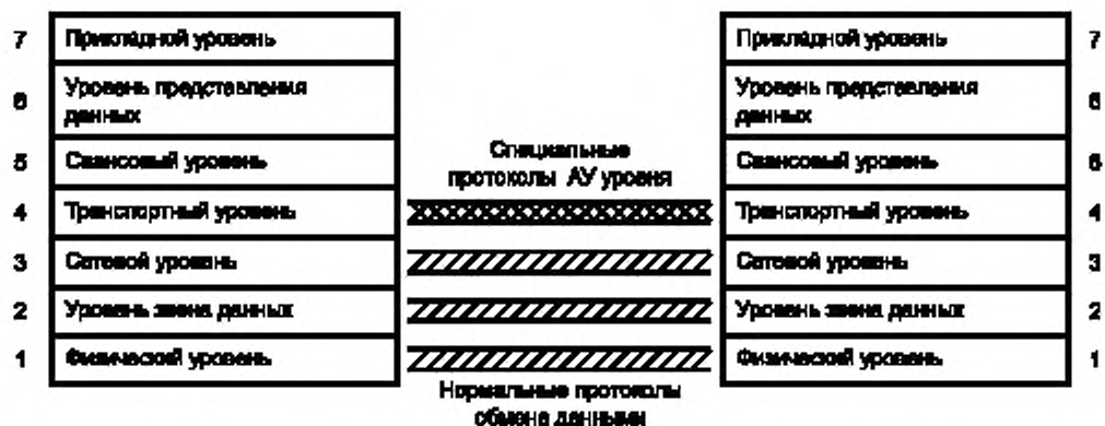
Рисунок А.2 — Обмен АУ (N)-уровня

Операции (N)-уровня представляют собой набор средств, контролирующих и управляющих отдельным сеансом обмена данными. Эти средства могут быть встроены в «нормальный» (N)-протокольный обмен (см. рисунок А.3), например, передавая информацию о тарифах в пакете «освобождение» X.25, либо таким средством может быть специальный элемент протокола типа «сброс» X.25.