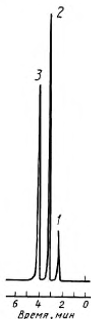
1 — сероводород; 2 — метилмеркаптан; 3 — этилмеркаптан

Типовые хроматограммы сероводорода, метил- и этилмеркаптанов и нефти приведены на рисунках 2—4.