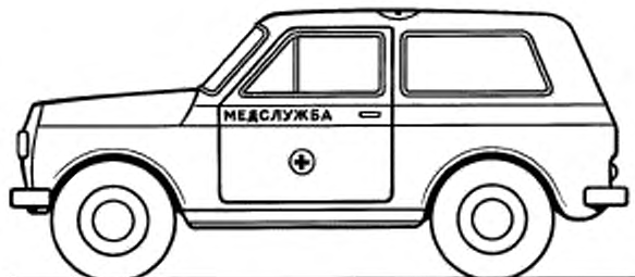
На кузове «КОМБИ»