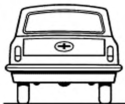
На кузове «СЕДАН»