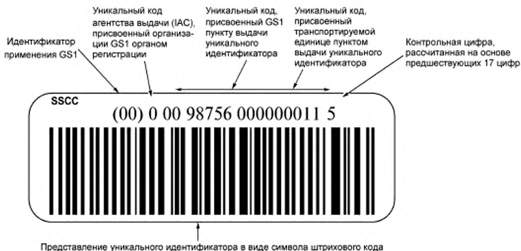
Рисунок В.1 — Представление уникального идентификатора транспортируемых единиц в символе штрихового кода GS1-128

В соответствии с правилами Всемирного почтового союза (УПУ) уникальный идентификатор должен содержать не более 35 алфавитно-цифровых знаков, где первый знак "J" является кодом агентства выдачи, присвоенным УПУ органом регистрации. Следующие знаки присваивает УПУ для учета и идентификации почтовых регионов. В соответствующих стандартах Всемирного почтового союза (УПУ) установлены несколько различных структур. Одна из них использует двухзначные коды стран в соответствии с ИСО 3166 для учета почтовых регионов национальных почтовых органов каждой страны. Этот «идентификатор почтового органа» сопровождается полем свободного формата, в котором каждый почтовый орган может устанавливать собственную структуру в рамках настоящего стандарта (рисунок В.2).