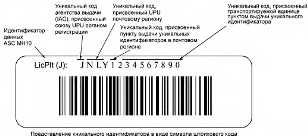
Рисунок В.2 — Представление уникального идентификатора транспортируемых единиц в символе штрихового кода Code 128

В соответствии с правилами Всемирного почтового союза (УПУ) уникальный идентификатор должен содержать не более 35 алфавитно-цифровых знаков, где первый знак "J" является кодом агентства выдачи, присвоенным УПУ органом регистрации. Следующие знаки присваивает УПУ для учета и идентификации почтовых регионов. В соответствующих стандартах Всемирного почтового союза (УПУ) установлены несколько различных структур. Одна из них использует двухзначные коды стран в соответствии с ИСО 3166 для учета почтовых регионов национальных почтовых органов каждой страны. Этот «идентификатор почтового органа» сопровождается полем свободного формата, в котором каждый почтовый орган может устанавливать собственную структуру в рамках настоящего стандарта (рисунок В.2).