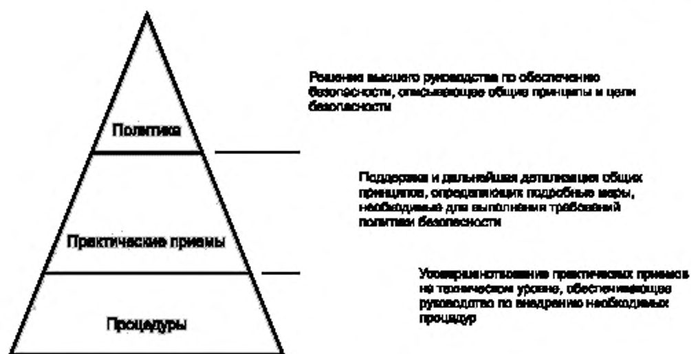
Рисунок 1 — Документация программы

В документах, относящихся к информационной безопасности, должны быть охвачены как высокоуровневые цели организации, так и конкретные, относящиеся к безопасности, настройке устройств, реализующих политику. Диапазон охвата целей лучше всего представить множественными уровнями документации. Число уровней должно быть сведено к минимуму, и настоящий стандарт рекомендует использование трех уровней: документация о политике, документация практических приемов обеспечения безопасности и документация операционных эксплуатационных процедур безопасности.