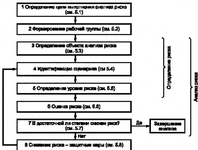
Рисунок 1 — Схема выполнения анализа и снижения риска