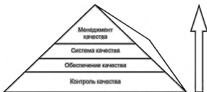
Рисунок 1 — Пирамида качества

Руководству лаборатории следует признать, что существует иерархия понятий, используемых для описания системы менеджмента качества услуг в области здравоохранения. Эти понятия, выстроенные с точки зрения управления, начинаются с общей философии менеджмента качества, в которой выражено стремление достичь качественных (безопасных, эффективных, своевременных и ориентированных на пациента) услуг в системе здравоохранения. Эта философия обычно охватывает менеджмент качества, который направлен на поддержание скоординированных и всеобъемлющих усилий соответствовать целям системы здравоохранения в области качества. Эти усилия известны как «система качества», которая включает в себя все виды деятельности в области обеспечения качества (часть менеджмента качества, сфокусированная на достижении уверенности в том, что требования к качеству будут выполнены) [1], а также все виды деятельности по контролю качества (часть менеджмента качества, сфокусированная на выполнении требований к качеству) [1] (см. рисунок 1).