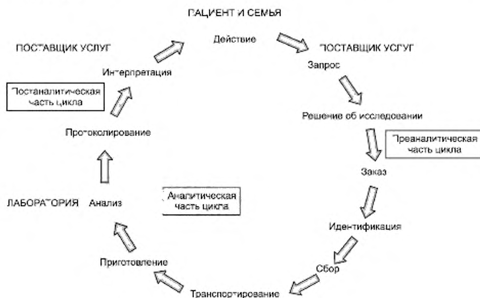
Рисунок 2 — Медицинская лаборатория. Полный цикл исследования

Необходимо постоянно проверять этот цикл для выявления возможности улучшения лабораторных услуг, например, путем сокращения числа образцов, не пригодных для исследований, которые получает лаборатория.