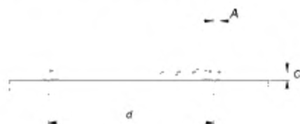
Рисунок 103 — Сосуд для испытания плиток

A — толщина основания и стенки ( 2 \pm 0,5 ) мм; C — максимальная вогнутость, d — диаметр плоской поверхности основания