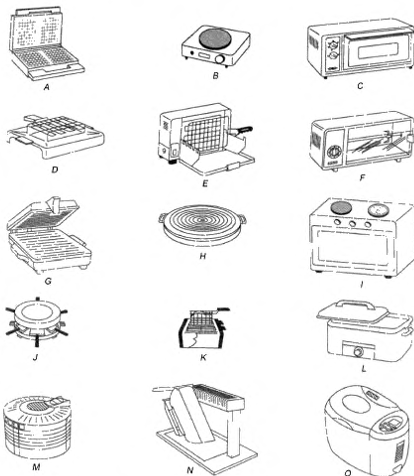
Рисунок 101, лист 1 — Примеры приборов