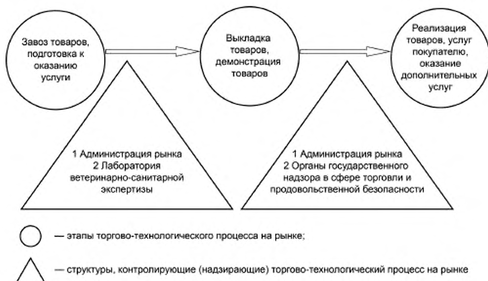
Рисунок 1 — Торгово-технологический процесс на розничном рынке