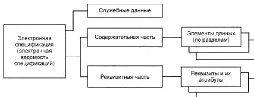
Рисунок 1 — Обобщенная структура ЭСП и ЭВС (верхнего уровня)

4.6 ЭСП (ЭВС), как правило, следует оформлять с применением ЭП (при наличии в АС средств, обеспечивающих проведение проверки подлинности ЭП). В этом случае порядок использования ЭП и источник сертификата ЭП устанавливаются стандартом организации — разработчика ЭСП (ЭВС).