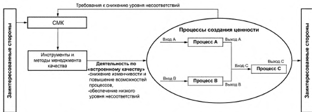
Рисунок 1 — Применение менеджмента качества при производстве продукции/оказании услуг

4.2.2 Применение методов и инструментов БП (ГОСТ Р 56407) направлено на повышение эффективности процессов, составляющих поток создания ценности (например, на их синхронизацию, сокращение времени и стоимости), и обеспечение их соответствия уровню спроса (ГОСТ Р 56906 — ГОСТ Р 56908). Применение подходов БП позволяет улучшать временные и стоимостные характеристики процессов, составляющих поток создания ценности, и повышает эффективность деятельности: