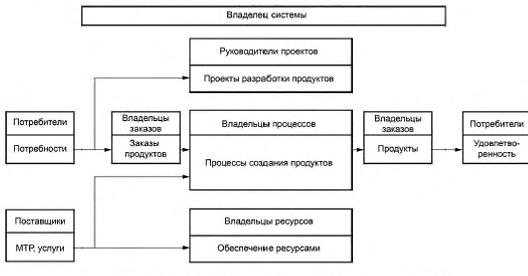
Рисунок 4 — Схема выполнения внешнего заказа в организации

5.8.1 Обобщенная схема выполнения внешнего заказа в организации и связанная с ним ответственность представлены на рисунке 4.