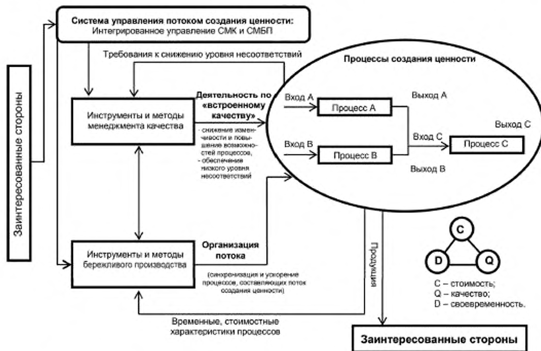
Рисунок 3 — Модель интеграции СМК и СМБП для управления потоком создания ценности 1)

На уровне системы менеджмента интеграция СМК и СМБП осуществляется через создание единой системы управления выходными характеристиками ПСЦ, обеспечивающей планирование, реализацию, контроль и улучшение ПСЦ (продукции и/или услуг) с необходимыми характеристиками качества, стоимости и времени потока продукции в соответствии с требованиями потребителей и других заинтересованных сторон организации (см. рисунок 3).