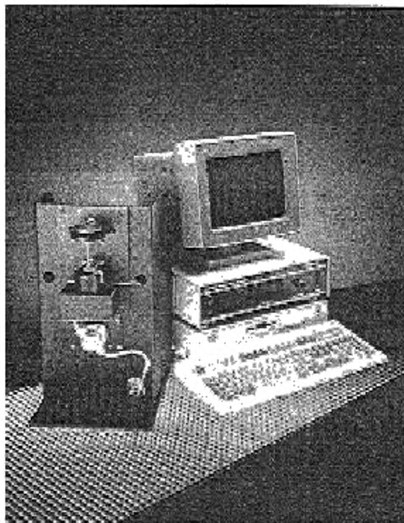
Рисунок 2 — Полуавтоматический CCS

6.3 Полуавтоматический CCS (рисунок 2), кроме указанного в 6.2, включает в себя компьютер, интерфейс компьютера и дозирующий насос для испытуемого образца.