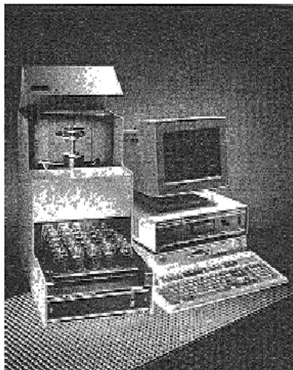
Рисунок 3 — Автоматический CCS

6.4 Автоматический CCS (рисунок 3), кроме указанного в 6.2, включает в себя автоматизированный стол для образцов, позволяющий испытывать одновременно до 30 образцов под контролем компьютера, без вмешательства оператора.