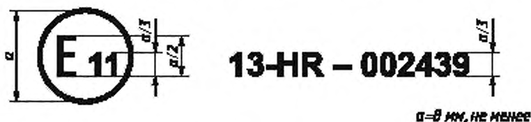
Образец А (См. пункт 4.4 настоящих Правил)

Приведенный выше знак официального утверждения, проставленный на транспортном средстве, указывает, что этот тип транспортного средства официально утвержден в Соединенном Королевстве (Е 11) в отношении тормозного устройства на основании настоящих Правил под номером официального утверждения 002439. Первые две цифры номера официального утверждения означают, что официальное утверждение предоставлено в соответствии с требованиями настоящих Правил в их первоначальном варианте.