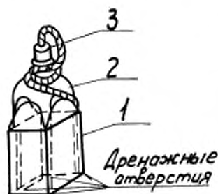
1 — футляр из нержавеющей стали; 2 — банка из полиэтилена; 3 — пробка из полиэтилена

В футляр вставляют банку из полиэтилена с навинчивающейся крышкой и закрепляют в футляре к ушкам проволокой из нержавеющей стали. При отборе проб вместо крышки банку закрывают пробкой из полиэтилена (фторопласта), к которой прикрепляют шнур из стойкого к продукту материала.