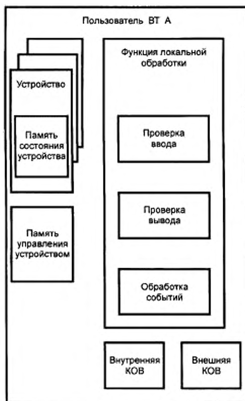
Рисунок 3 — Структура терминального пользователя ВТ

Во время обработки данных от своих устройств обновления объекта пользователь ВТ может идентифицировать события, которые имеют значение в семантике объектов, присутствующих в КОВ. Примерами являются события ввода в поле и события завершения, которые определены в 3.3.65 и 3.3.72 ГОСТ Р ИСО 9040 соответственно. Эти события вызывают действия, определенные семантикой этих объектов. Результатом этих действий может быть обновление объекта или «доставка»