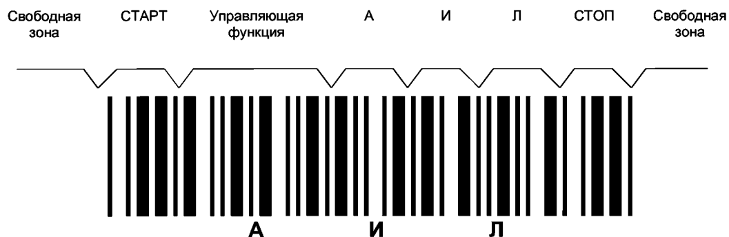
Рисунок ДА.1 — Символ штрихового кода, в котором закодированы знаки АИЛ

Служебные знаки «- -», «..» при декодировании не передаются и в визуальном представлении не указываются. Символы штрихового кода, в котором закодированы знаки АИЛ, приведены на рисунке ДА.1.