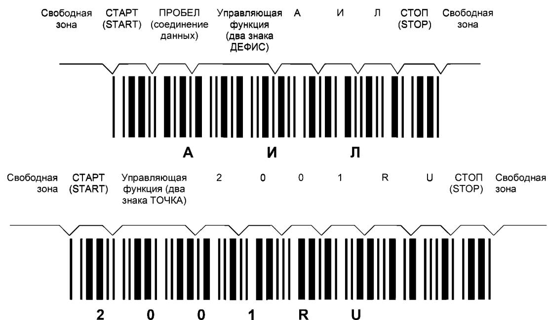
Рисунок ДА.2 — Символы штрихового кода, в которых закодированы данные АИЛ2001RU

Символы штрихового кода, в которых закодированы данные АИЛ2001RU, приведены на рисунке ДА.2.