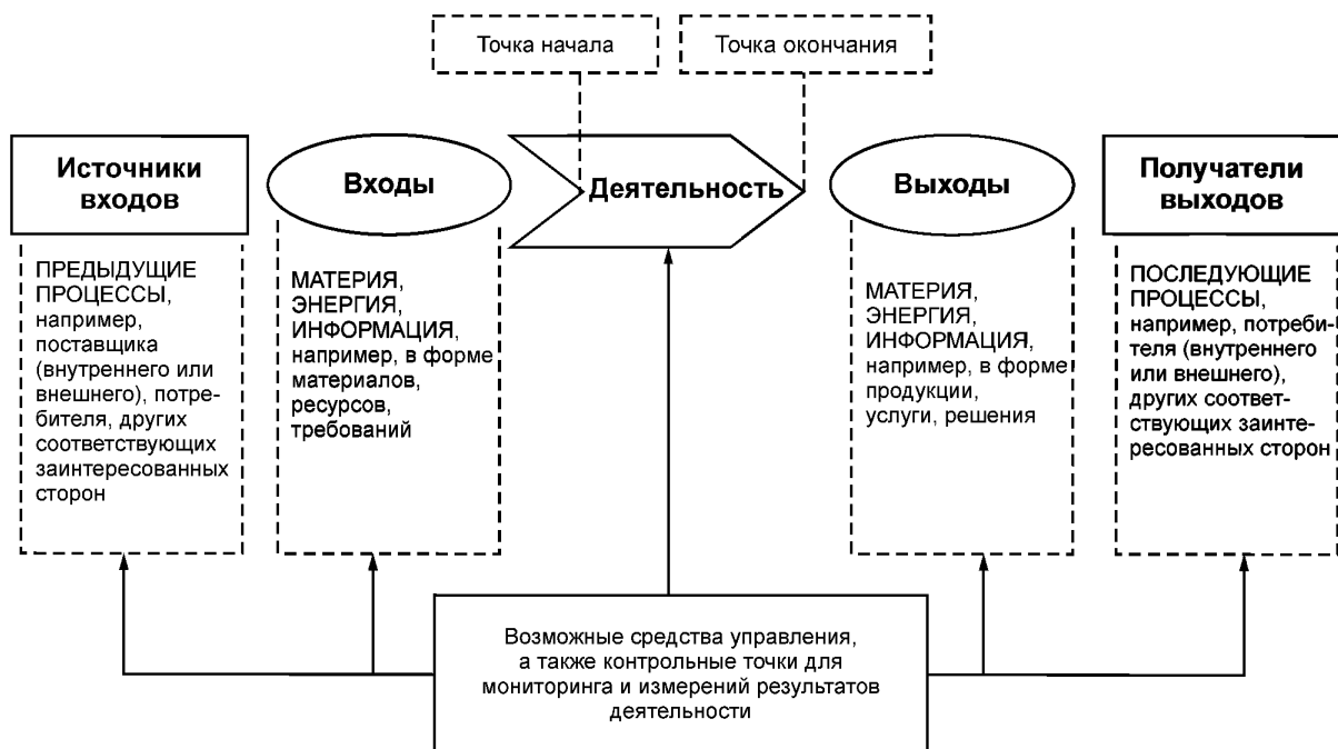
Рисунок 1 — Схематичное изображение элементов процесса

Рисунок 1 дает схематичное изображение любого процесса и иллюстрирует взаимосвязь элементов процесса. Контрольные точки мониторинга и измерения, необходимые для управления, являются специфическими для каждого процесса и будут варьироваться в зависимости от соответствующих рисков.