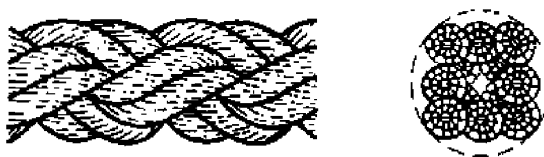
Рисунок 3- Конфигурация 8-рядного плетеного каната (тип L)