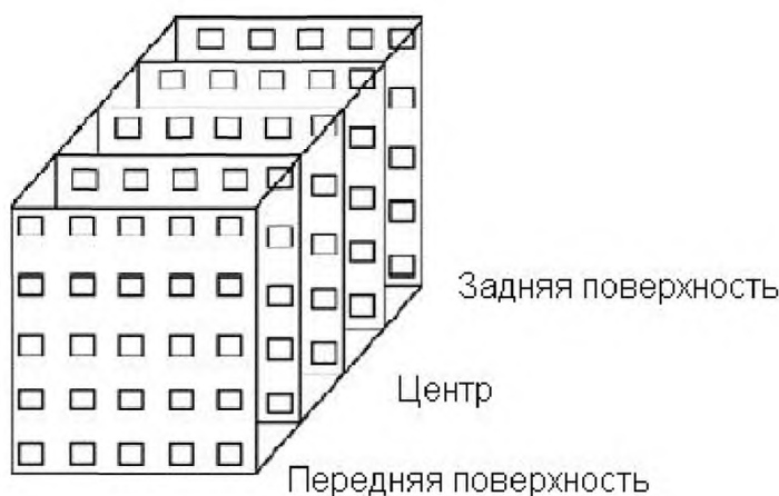
Рисунок 1 – Размещение дозиметров для картирования дозы в контейнере с продуктом в случае фотонного облучения.

Примечание — При проведении исследований, связанных с подавлением паразитов, патогенных бактерий, вирусов и т.п., часто используют небольшие образцы, с тем чтобы минимизировать количество пищевого или сельскохозяйственного материала, зараженного данной биологической компонентой. Такая практика способствует ограничению распространения инфекционного биологического агента и облегчает лабораторному персоналу безопасную работу с материалом в контролируемой обстановке. Эти образцы могут иметь очень малый объем и вес. В этом случае исследователь может использовать небольшие дозиметры для получения карты поглощенных доз в незараженном материале. В тех случаях, когда материал, подлежащий облучению, имеет размеры порядка нескольких миллиметров или массу порядка нескольких граммов, дозиметры могут прикрепляться к стенкам контейнеров, содержащих образцы, и в такой конфигурации измеряется поглощенная доза.