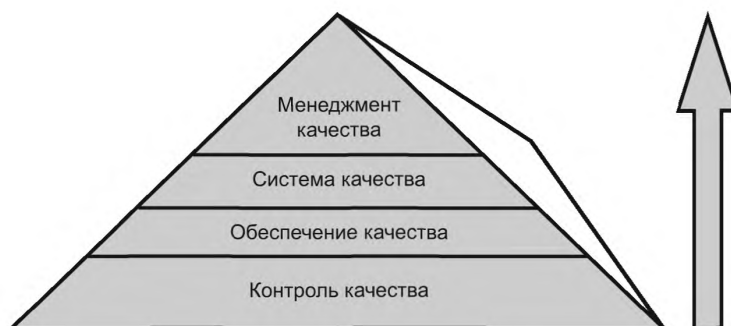
Рисунок 1 — Пирамида качества

Руководству лаборатории следует признать, что существует иерархия понятий, используемых для описания системы менеджмента качества услуг в области здравоохранения. Эти понятия, выстроенные с точки зрения управления, начинаются с общей философии менеджмента качества, в которой выражено стремление достичь качественных (безопасных, эффективных, своевременных и ориентированных на пациента) услуг в системе здравоохранения. Эта философия обычно охватывает менеджмент качества, который направлен на поддержание скоординированных и всеобъемлющих усилий соответствовать целям системы здравоохранения в области качества. Эти усилия известны как «система качества», которая включает в себя все виды деятельности в области обеспечения качества (часть менеджмента качества, сфокусированная на достижении уверенности в том, что требования к качеству будут выполнены) [1], а также все виды деятельности по контролю качества (часть менеджмента качества, сфокусированная на выполнении требований к качеству) [1] (см. рисунок 1).