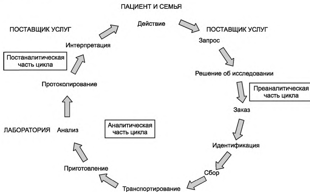
Рисунок 2 — Медицинская лаборатория. Полный цикл исследования

Необходимо постоянно проверять этот цикл для выявления возможности улучшения лабораторных услуг, например, путем сокращения числа образцов, не пригодных для исследований, которые получает лаборатория.