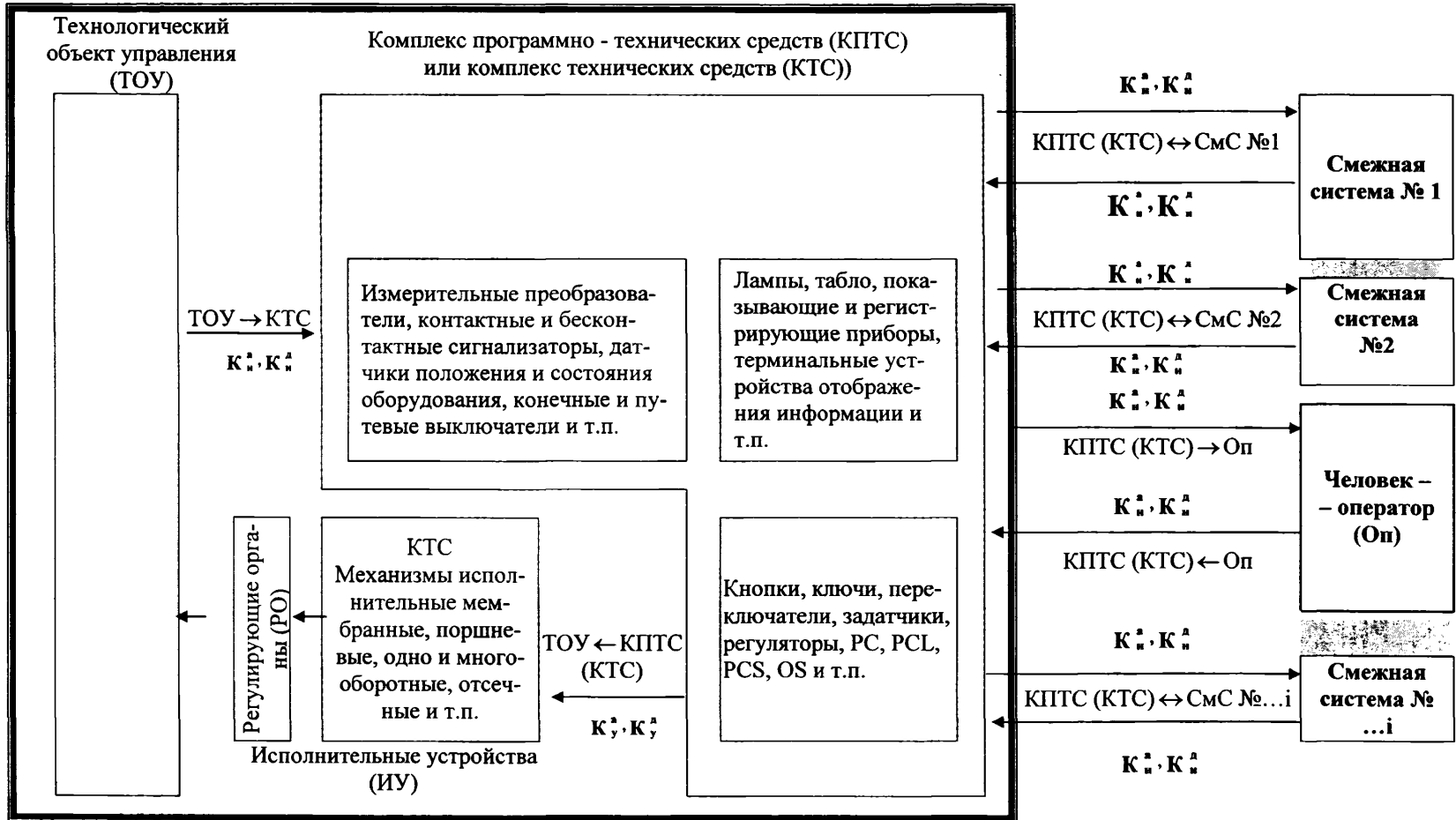
СХЕМА АВТОМАТИЗИРОВАННОГО ТЕХНОЛОГИЧЕСКОГО КОМПЛЕКСА (АТК)