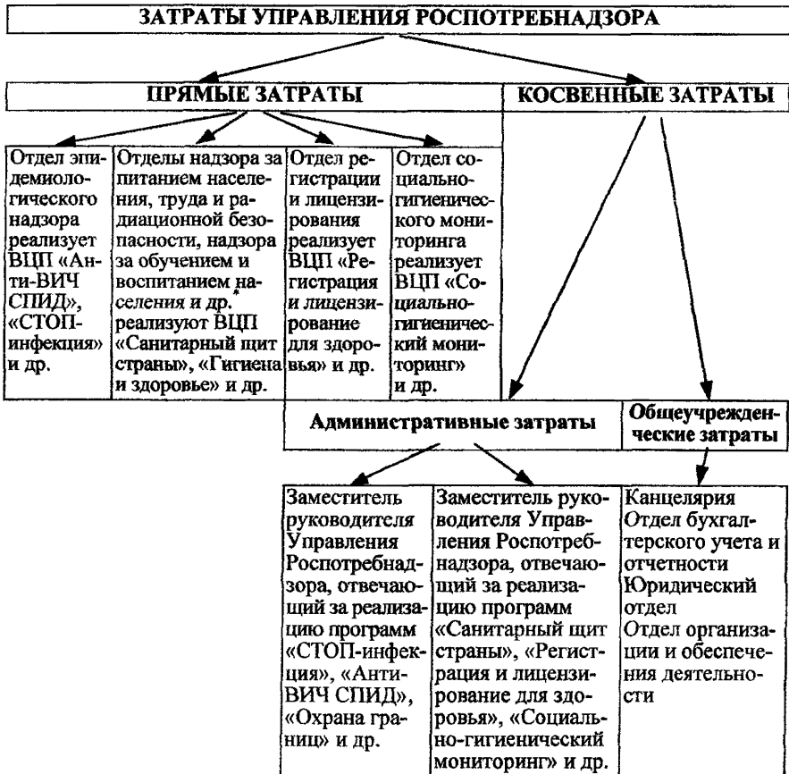
Рис. 2. Примерная схема распределения затрат некоторых ВЦП Управления Роспотребнадзора со штатной численностью свыше 300 ед.

Помимо затрат на персонал, работающий только в рамках реализации данной программы, к прямым затратам следует отнести в полном объеме затраты на приобретение необходимых для выполнения ВЦП материалов, электроэнергии, компьютерных и иных услуг, а также на содержание и ремонт зданий, сооружений и оборудования, использующихся только в этой ВЦП, а к косвенным – часть затрат на содержание и ремонт зданий, сооружений и оборудования, использующихся в нескольких ВЦП.