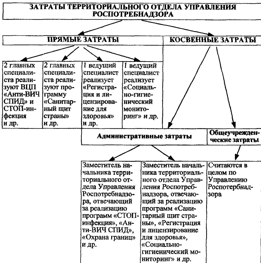
Рис. 3. Примерная схема распределения затрат некоторых ВЦП в территориальном отделе Управления Роспотребнадзора