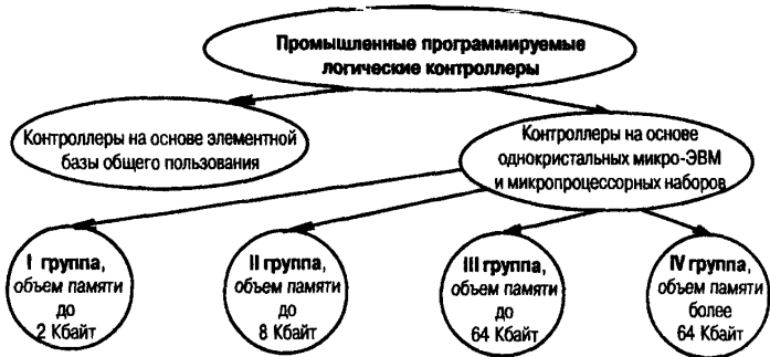
Рис. 1. Условная классификация промышленных контроллеров

На рис. 1 показана условная классификация промышленных контроллеров.