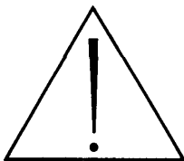
Рисунок 202 — Символ 14, таблица D1, приложение D ГОСТ Р 50267.0.

Внимание! См. в ЭКСПЛУАТАЦИОННЫХ ДОКУМЕНТАХ