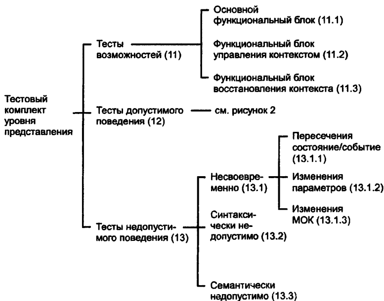
Рисунок 1 — Структура тестового комплекта уровня представления

Каждая из этих групп подразделена на ряд тестовых групп более низкого уровня. Полная структура большинства тестовых групп дана на рисунках 1 и 2.