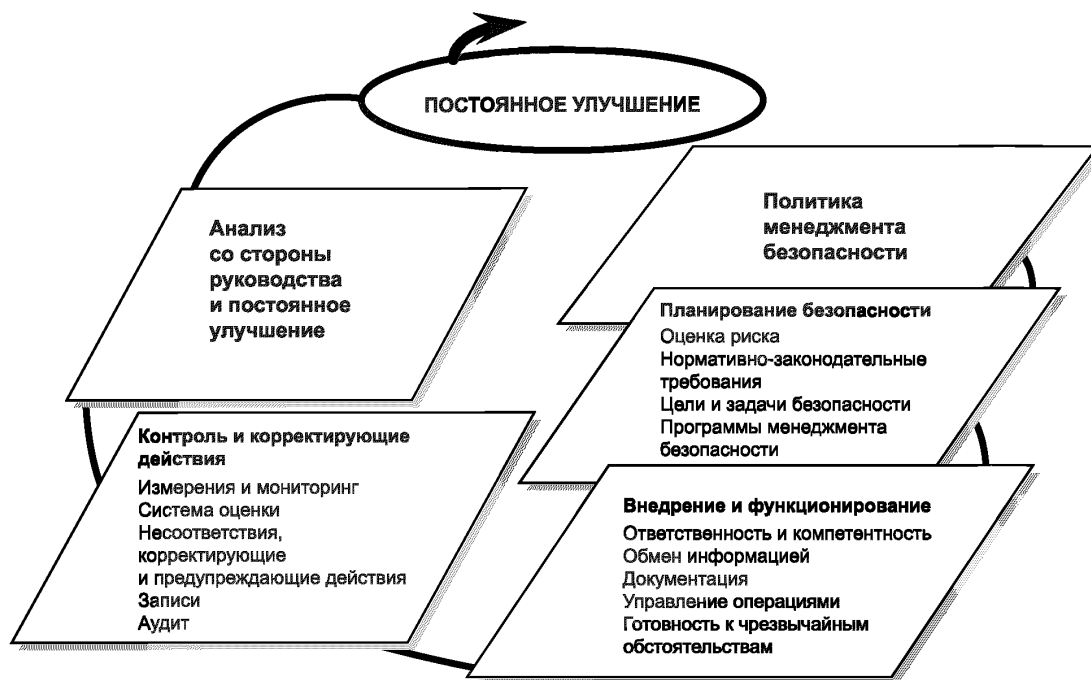
Рисунок 2 — Элементы системы менеджмента безопасности