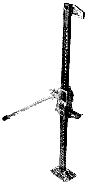
Рисунок 1 — Пример реечного домкрата

Домкраты следует изготавливать в соответствии с требованиями настоящего стандарта и конструкторской документации (КД), утвержденной в установленном порядке.