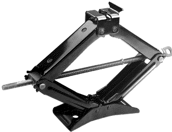
Рисунок 3 — Пример ромбического домкрата