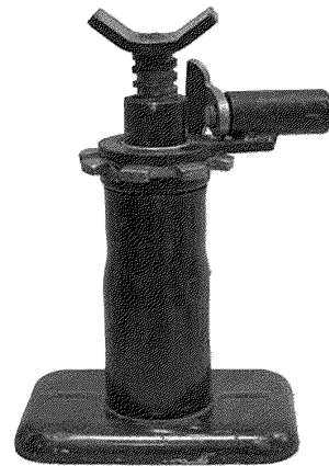
Рисунок 4 — Пример стоечного домкрата

4.3 Литые металлические детали домкратов должны соответствовать требованиям ГОСТ 977, ГОСТ 1215 и ГОСТ 1412.