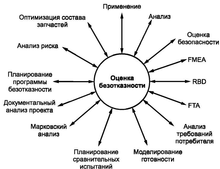
Рисунок 1 — Методы, использующие в качестве входных данных оценку безотказности

В таблице 2 приведены стандарты на методы, использующие в качестве входных данных оценку безотказности.