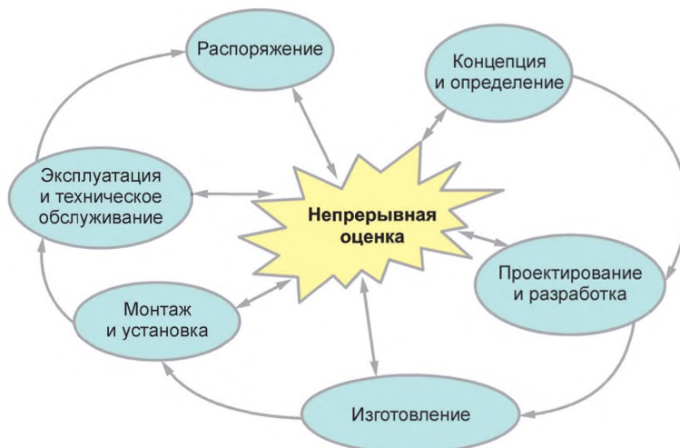
Рисунок 2 — Стадии жизненного цикла продукции

На рисунке 2 показаны стадии жизненного цикла продукции и необходимость оценок безотказности на каждой стадии процесса в качестве входных и выходных данных.