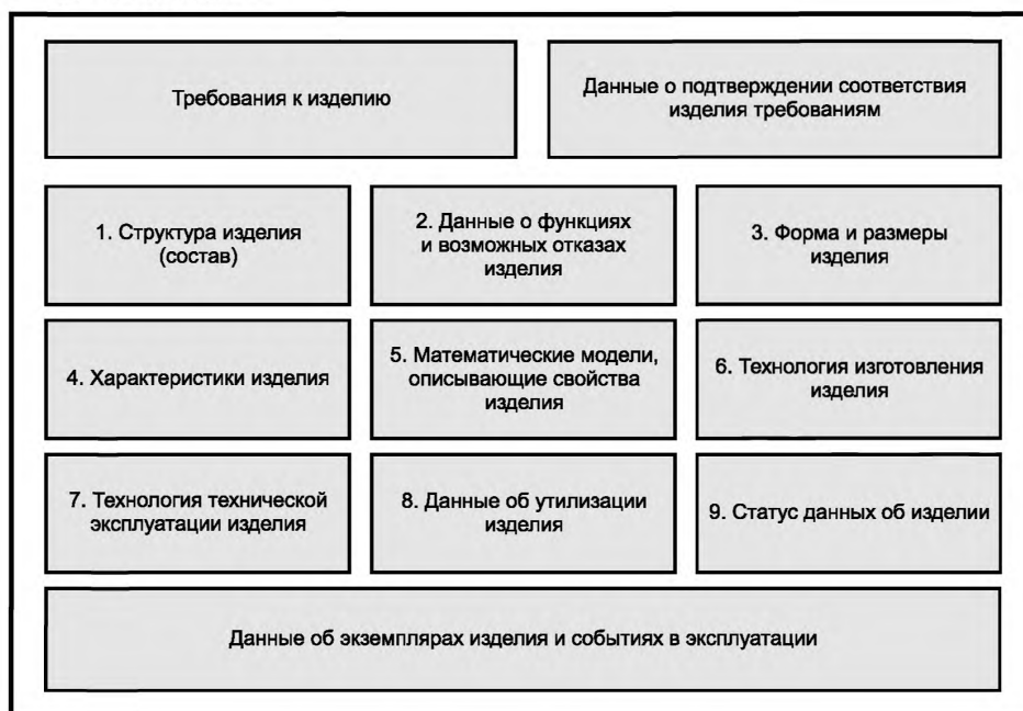
Рисунок 2 — Данные об изделии в АС УДИ