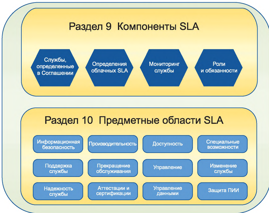
Рисунок 2 — Компоненты SLA и предметные области SLA