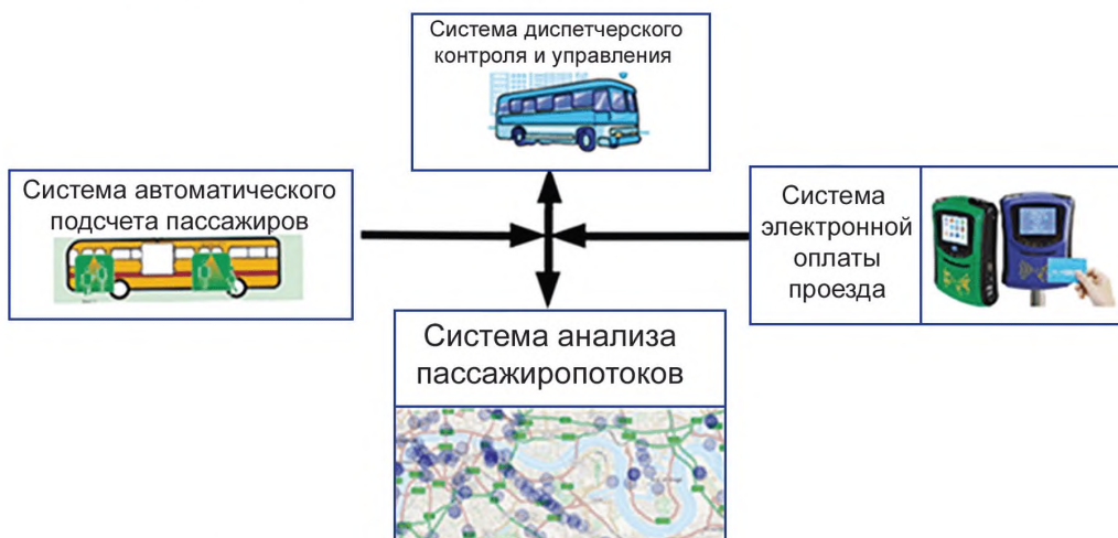
Рисунок 1 — Схема взаимодействия САП с источниками данных

Помимо данных от СПП в САП используется информация из АСДУ и АСОП. Синтез данных от указанных систем позволяет определить параметры пассажиропотоков и оценку качества перевозки пассажиров в различных «разрезах» и для различных уровней агрегации. Общая схема взаимодействия САП с источниками данных представлена на рисунке 1.