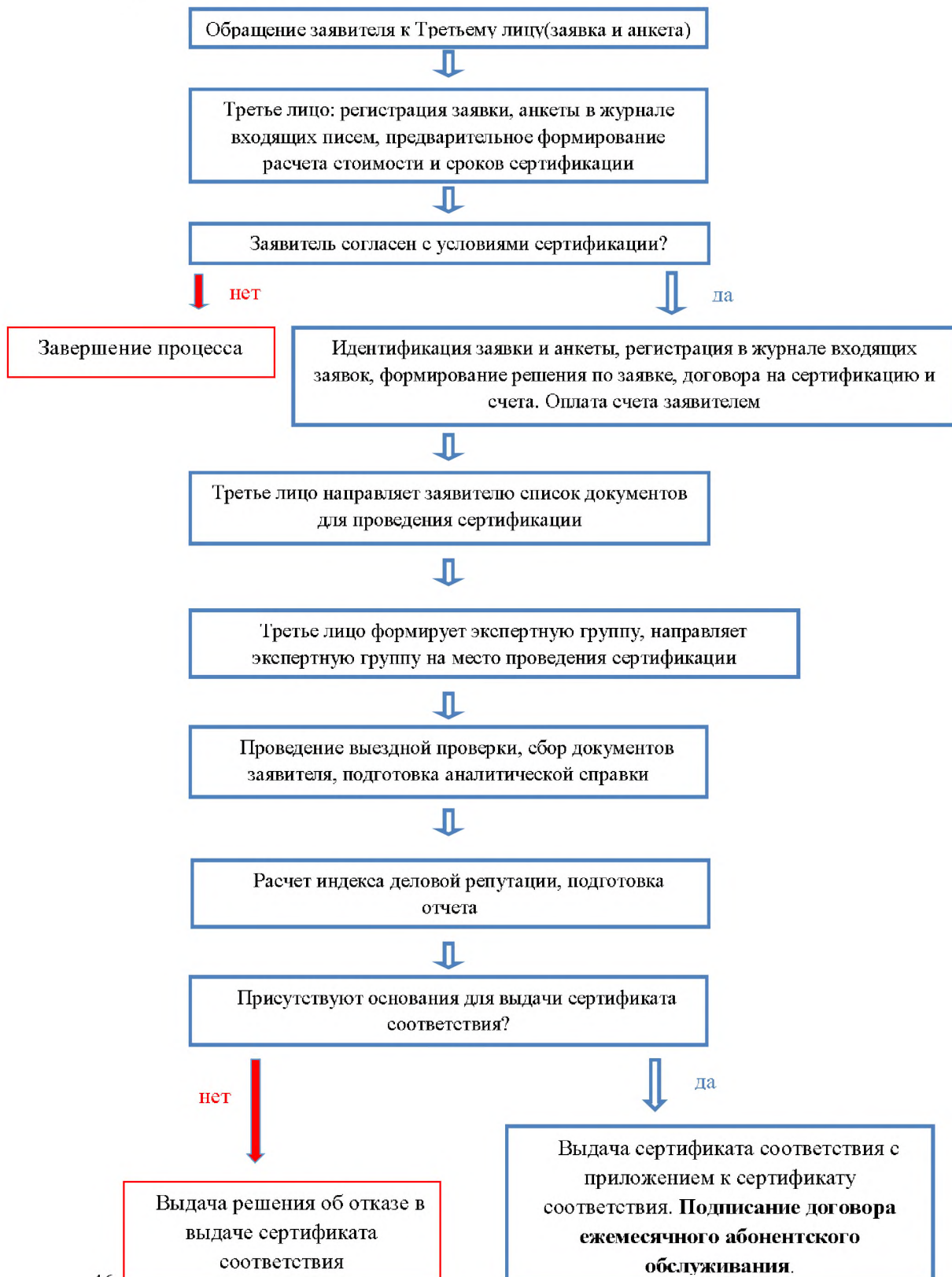
Схема сертификации №1.