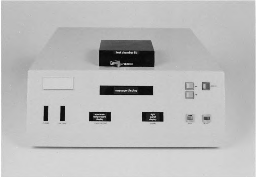
Рисунок А1.3 — Внешний интерфейс прибора