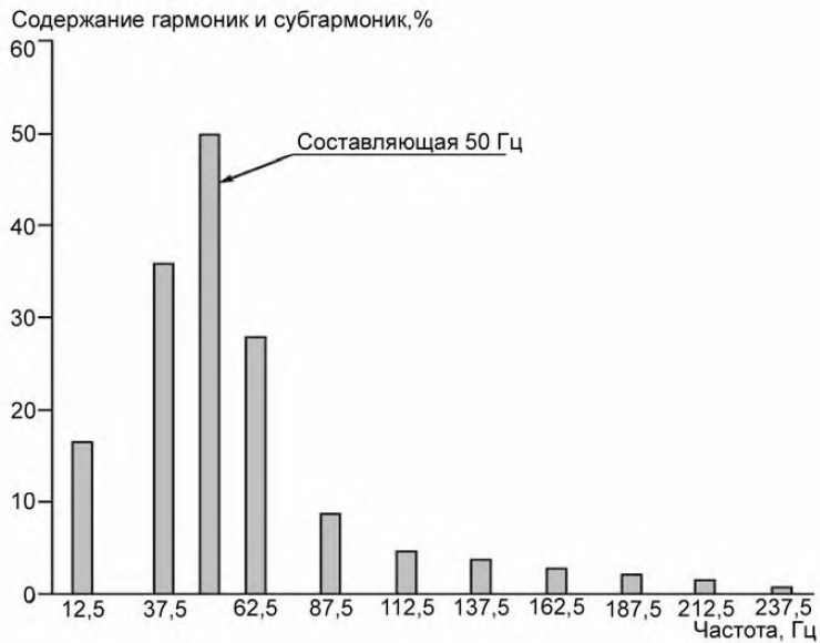
Рисунок А.3 – Распределение гармоник (анализ Фурье не завершен)