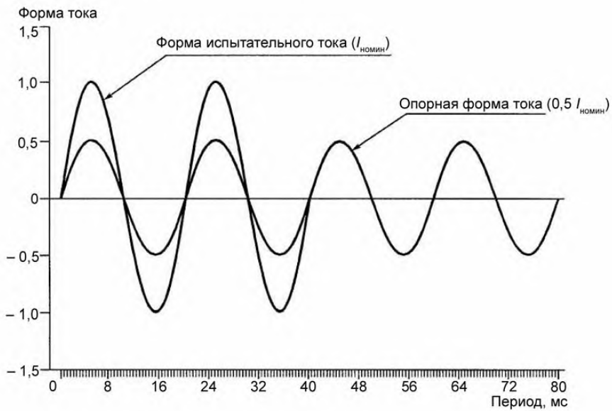
Рисунок А.2 – Форма тока при испытаниях на влияние субгармоник