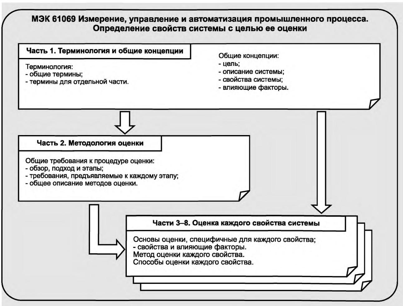
Рисунок 1 — Общий состав МЭК 61069

Некоторые примеры элементов оценки объединены в приложении С.