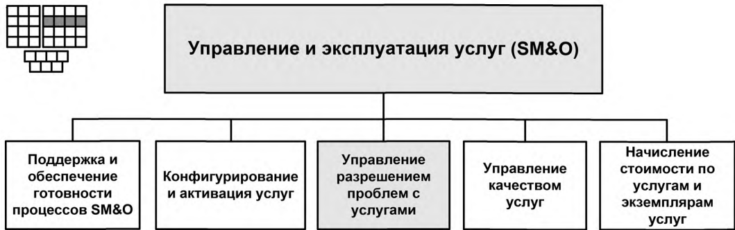
Рисунок 1 — Декомпозиция группы процессов SM&amp;O на элементы процессов уровня 2