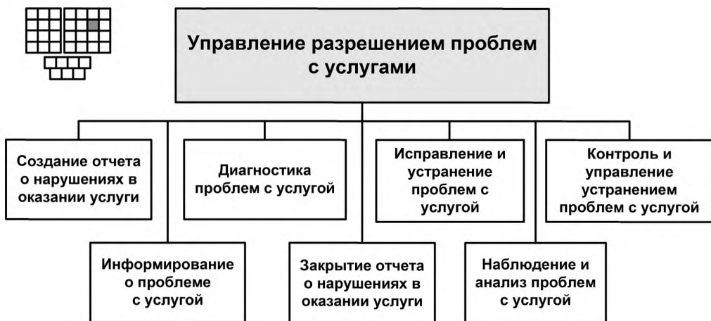
Рисунок 3 — Декомпозиция процесса 1.1.2.3 «Управление разрешением проблем с услугами» на элементы процессов уровня 3

6.1 Структура процесса 1.1.2.3 «Управление разрешением проблем с услугами» и соответствующие элементы процессов уровня 3 представлены на рисунке 3.