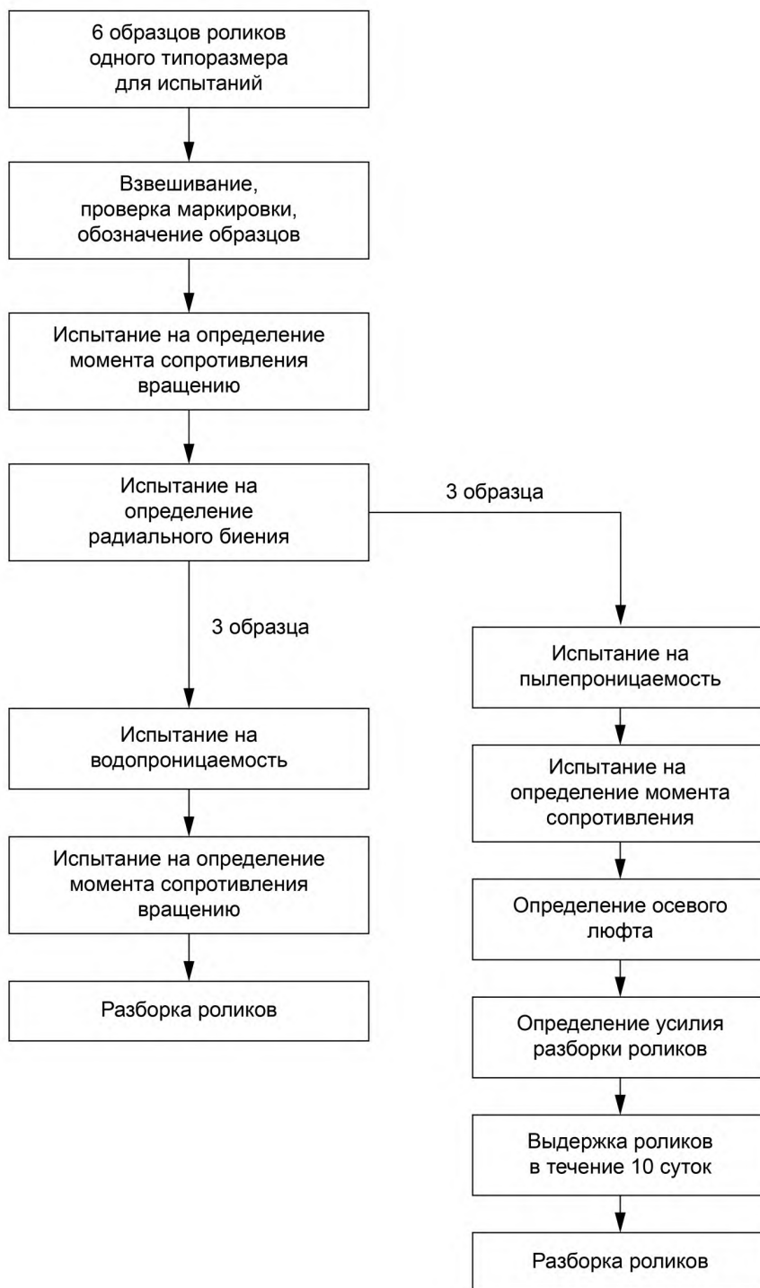
Рисунок 2 — Схема проведения испытаний