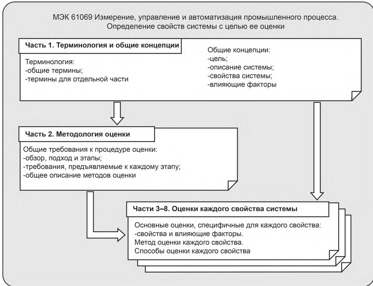
Рисунок 1 — Общий состав МЭК 61069