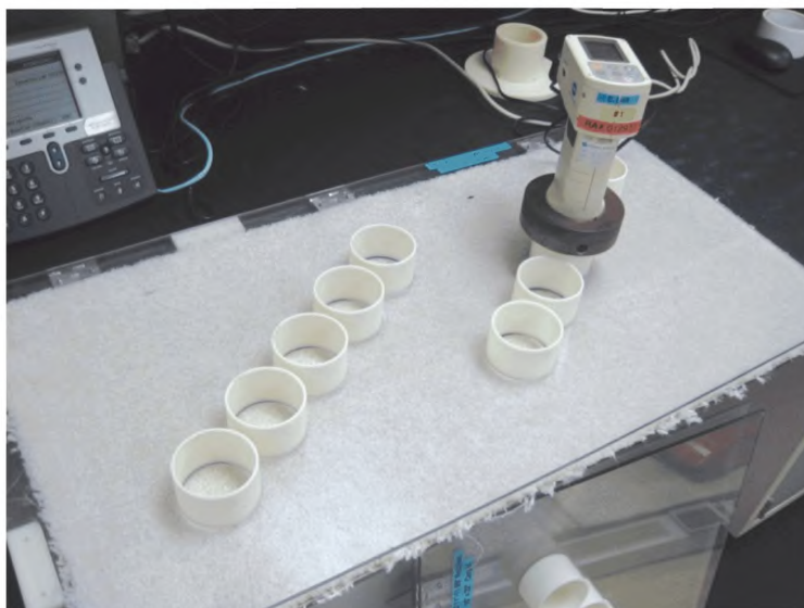
Рисунок 3 — Шаблон для измерения цвета ковра и колориметр

5.2.1.3.5 Незагрязненные образцы ковра искусственно пачкаются, используя метод испытаний ASTM D6540 для ускоренного загрязнения ворсовых ковровых покрытий. Образцы ковра помещаются в пачкающий цилиндр вместе с предопределенным количеством загрязненных шариков полимера и хромированных шариков легированной стали, и затем вращаются на предписанной скорости определенное количество минут в каждом из двух направлений, чтобы включить загрязнения в волокна ковра. (Типичный цилиндр для загрязнения ковра, подготовленный к ускоренному загрязнению, представлен на рисунке 4).