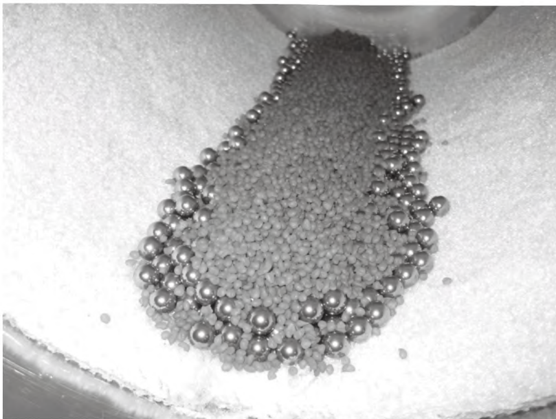
б) Загрязненные полимерные шарики в цилиндре