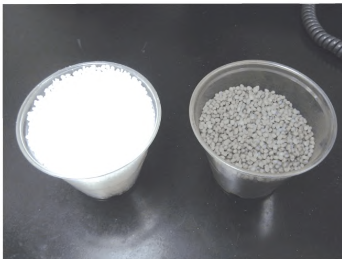
Рисунок 1 — Полимерные шарики — Незагрязненные и загрязненные

5.2.1.3.3 Испытательные образцы ковра подготавливают, обрезая ковер на куски 450 мм шириной и 900 мм длиной с длинным измерением всегда в направлении ворса. Ковры, рекомендуемые для этого испытания, описаны в 7.2.2.