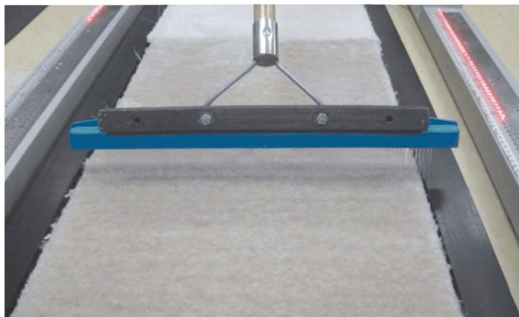
Рисунок 2 — Утяжеленная граблеобразная щетка для чистки