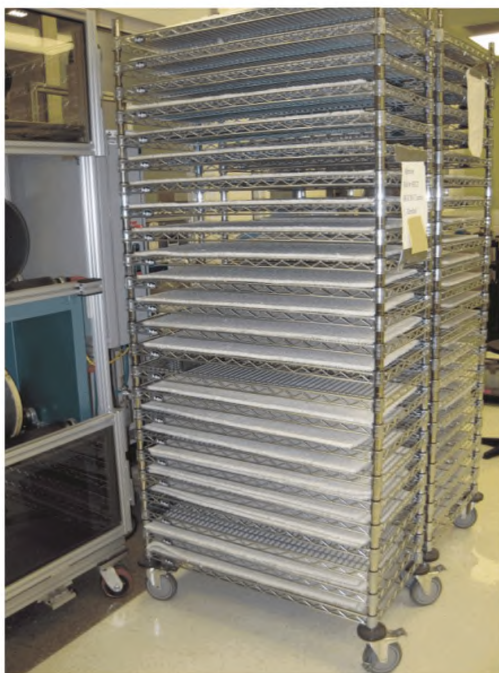
Рисунок 6 — Рейка для сушки ковра