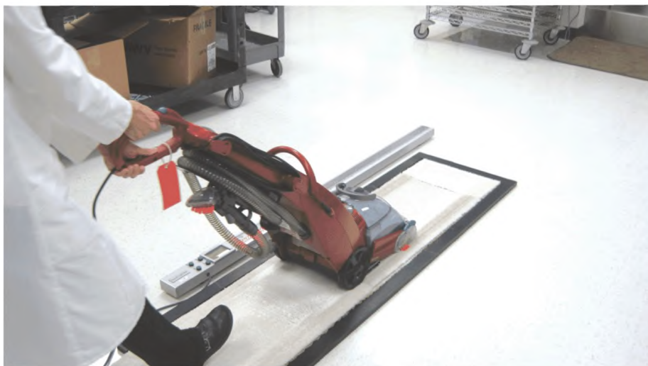
Рисунок 5 — Пример чистки ковра

один двойной ход, без распределения моющего раствора (сухо пылесосящие ходы). Этот цикл чистки выполняется на предписанной скорости хода, которой управляют. Очищенные ковры убираются в сторону и сохнут в течение по крайней мере 16 ч или до абсолютно сухого состояния. (См. пример рейки для высыхания ковра на рисунке 6).