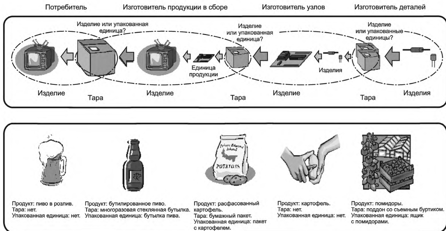
Рисунок А.1 — Изделие (продукт), упакованная единица продукции и тара в различных вариантах использования

На рисунке А.1 представлена сущность проблемы и приведены основные рекомендации для пункта выдачи ключевых идентификаторов по корректному, насколько это возможно, присвоению наиболее подходящего идентификатора объекту (изделию (продукту) или упакованной единице продукции).