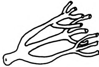
Рисунок 4 — Соплодие гвоздики