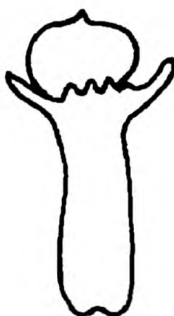
Рисунок 1 — Целая гвоздика

3.6 молотая (порошкообразная) гвоздика [ground (powdered) clove]: Порошок, полученный в результате измельчения гвоздики без каких-либо добавок.