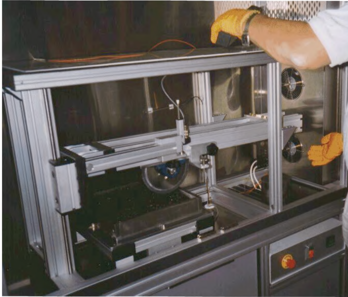
Рисунок Г.3 - Общий вид устройства предназначенного для определения колееобразования асфальтобетонных покрытий прокатыванием нагруженного колеса