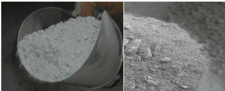
Рисунок Г.1 - Общий вид минеральной части асфальтобетонной смеси (ДАБС) с фиброволокном перед введением битума