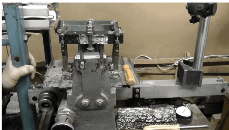
Рисунок Г.6 – Прибор ФР-2 (флексометр), позволяющий проводить испытания образцов асфальтобетона на усталость при изгибе с целью оценки усталостной долговечности в лабораторных условиях