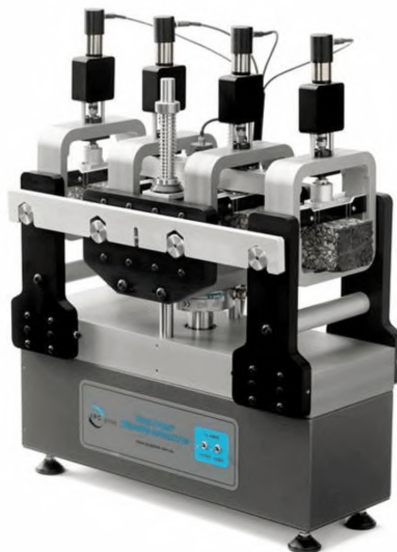
Рисунок Г.5 -Приспособление для испытаний на усталостную долговечность при 4-х точечном изгибе асфальтобетонных покрытий