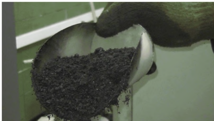
Рисунок Г.2 - Общий вид асфальтобетонной смеси (ДАБС) с синтетическими волокнами