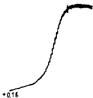
Рис. Полярографическая волна молибдена в сульфатно-хлоритном растворе. Концентрация 2мкг/мл.