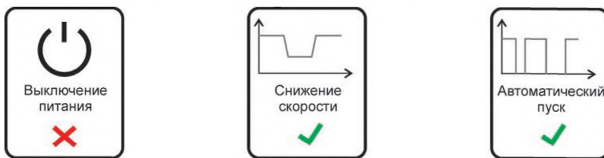
Рисунок 2 — Указатель режима работы эскалатора, указанного в примере 1

Пример 2. Эскалатор тяжелого режима работы с высотой подъема 65 м, с углом наклона 30° и максимальной скоростью V = 0,75 м/с. Потребляемая мощность в холостом режиме 17,8 кВт, что составляет 76 % от базового значения по таблице А.2 и соответствует классу В энергетической эффективности. Энергосберегающие режимы не применяются.