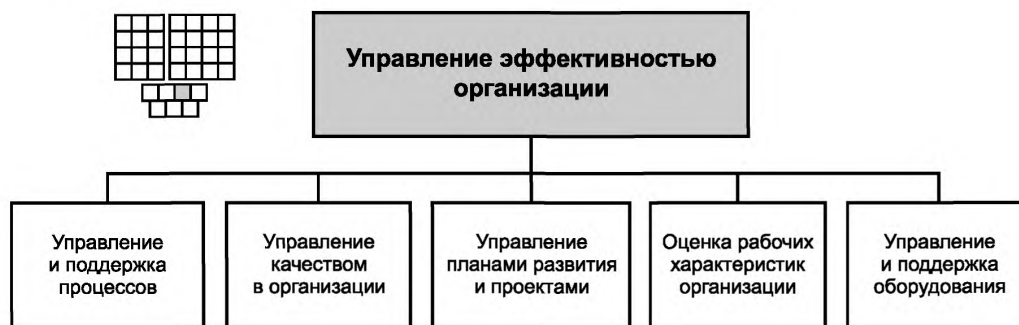
Рисунок 3 — Декомпозиция группы процессов «Управление эффективностью организации» на элементы процессов уровня 2

6.2 Процессы группы 1.3.3 предназначены для управления деятельностью организации с целью обеспечения рационального и эффективного выполнения производственных процессов.