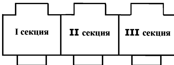
Рисунок 1 - Схема расположения объекта строительства