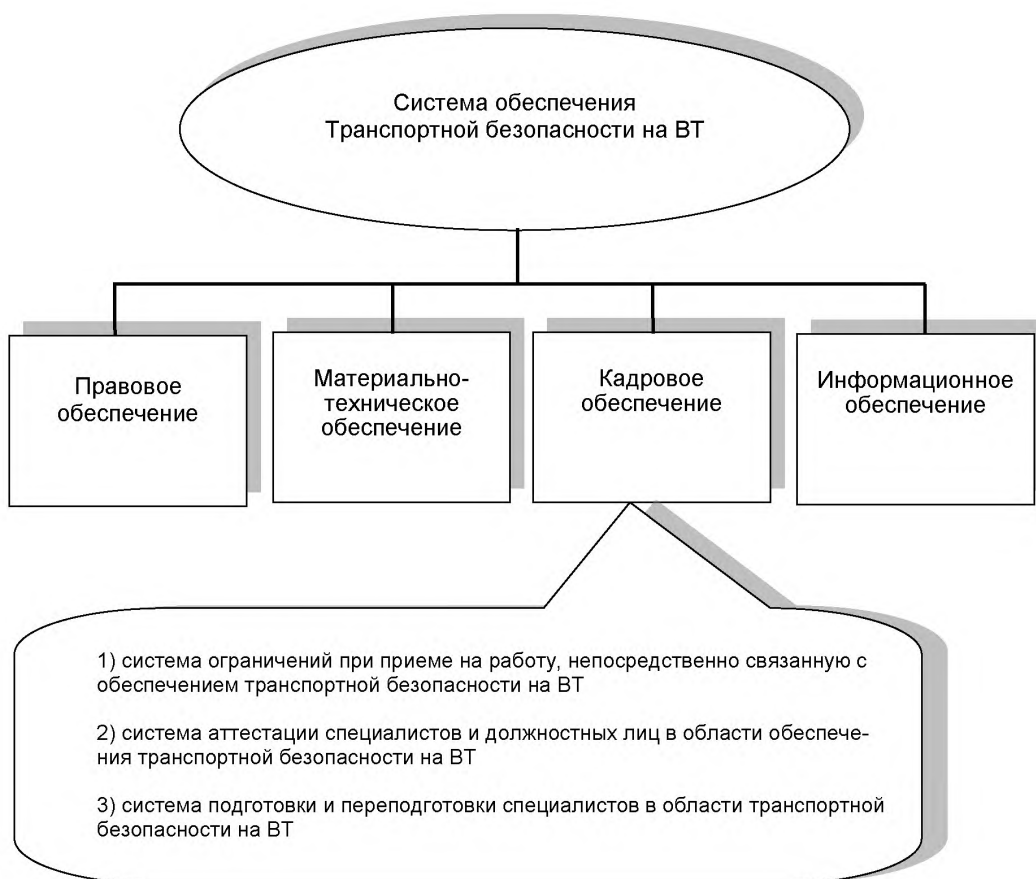
Рисунок 1 — Место кадрового обеспечения транспортной безопасности в общей системе обеспечения транспортной безопасности в Российской Федерации

Каждый из указанных элементов представляет собой подсистему определенных взаимосвязанных элементов.