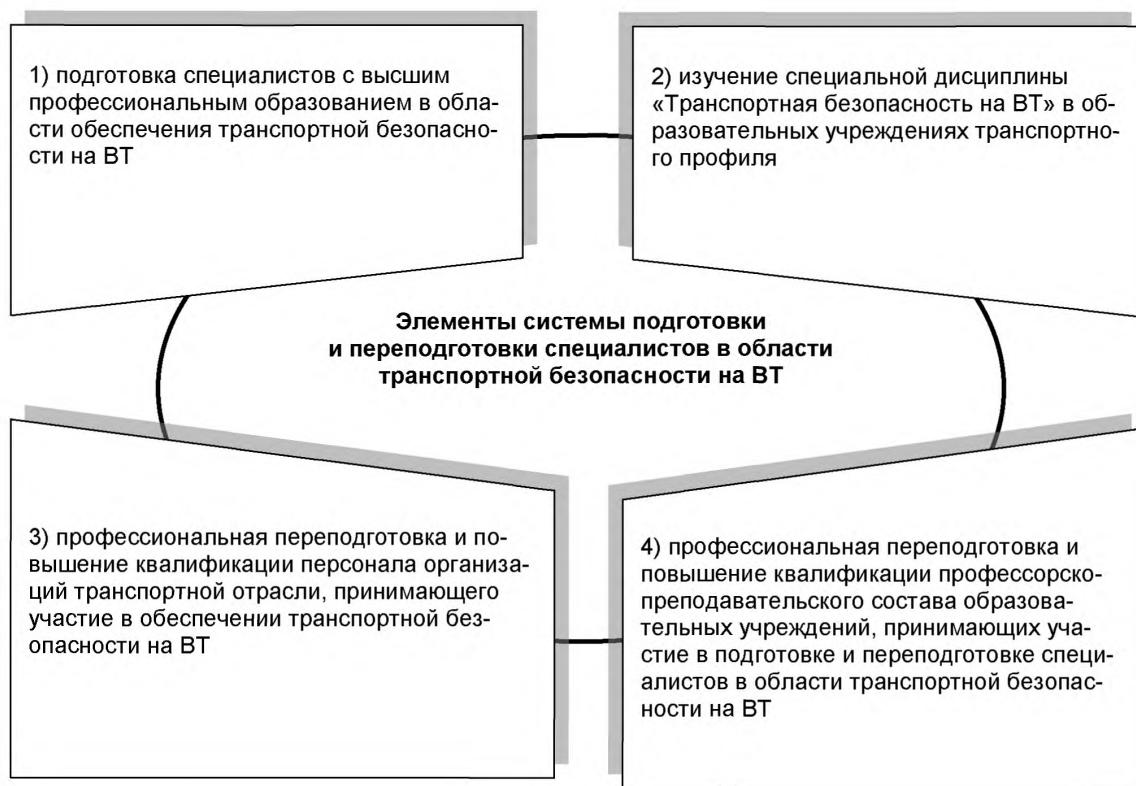
Рисунок 2 — Система подготовки и переподготовки специалистов в области обеспечения транспортной безопасности на ВТ в Российской Федерации (перспективная модель)

Согласно Комплексной программе обеспечения безопасности населения на транспорте, утвержденной распоряжением Правительства Российской Федерации от 30 июля 2010 г. № 1285р, создание системы профессиональной подготовки и обучения специалистов и должностных лиц в области обеспечения транспортной безопасности на ВТ, а также персонала, принимающего участие в обеспечении транспортной безопасности на ВТ, в том числе в части предотвращения и защиты от чрезвычайных ситуаций природного и техногенного характера на транспорте, является одним из приоритетных направлений обеспечения транспортной безопасности на ВТ в Российской Федерации.