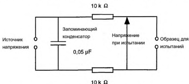
Рисунок 1 — Электрическая схема для испытания напряжением постоянного тока

Испытания напряжением постоянного тока проводят, используя схему рисунка 1.