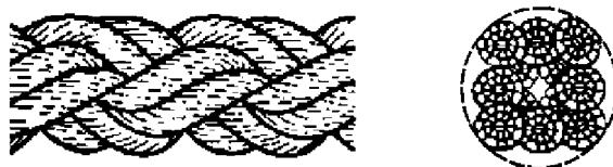
Рисунок 3 — Конфигурация 8-рядного плетеного каната (тип L)

5.2 Конструкция, изготовление, шаг крутки, маркировка, упаковка и поставляемые длины должны соответствовать ISO 9554.